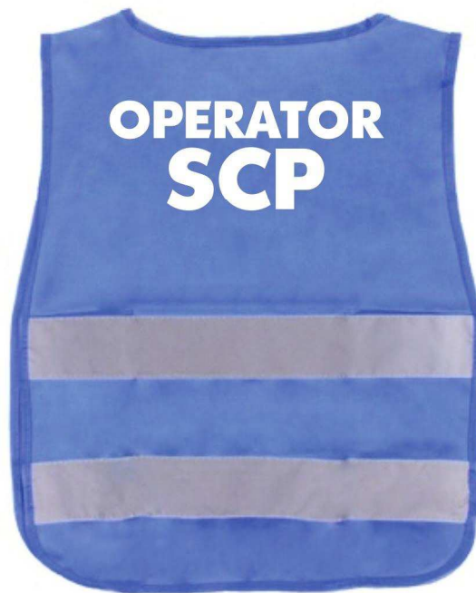
vestă - spate

Descriere: Salariatii SCP vor purta veste din material textil de culoare albastra inscriptionate pe fata si pe spate cu mesajul "OPERATOR SCP" de culoare alba.