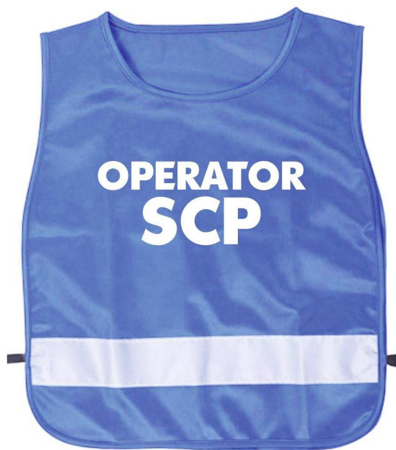
vestă - față

Denumire: Vestimentatia salariatilor SCP